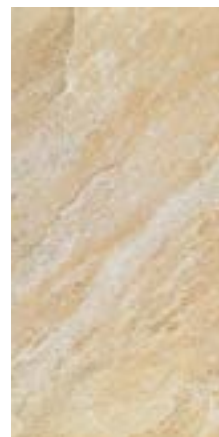
QUEBEC NATUR 45x90x3 cm natur, unglasiert rektifiziert

Art. Nr. 178.00775 CHF 119.00/m 2 exkl. MwSt