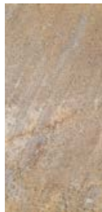
QUEBEC BEIGE 45x90x3 cm natur, unglasiert rektifiziert

Art. Nr. 178.00775 CHF 119.00/m 2 exkl. MwSt