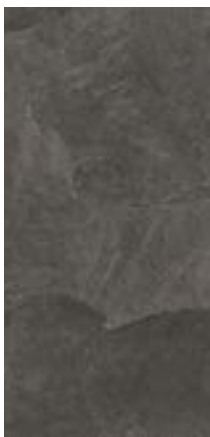
AZOREN SCHWARZ 45x90x3 cm natur, unglasiert rektifiziert

Art. Nr. 178.00773 CHF 119.00/m 2 exkl. MwSt