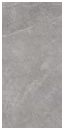
AZOREN GRAU 45x90x3 cm natur, unglasiert rektifiziert

Art. Nr. 178.00773 CHF 119.00/m 2 exkl. MwSt